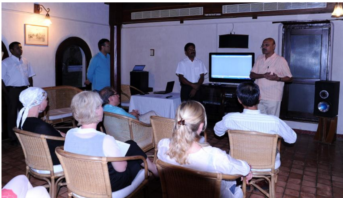
Orientering, innsalg og site inspections hørte med